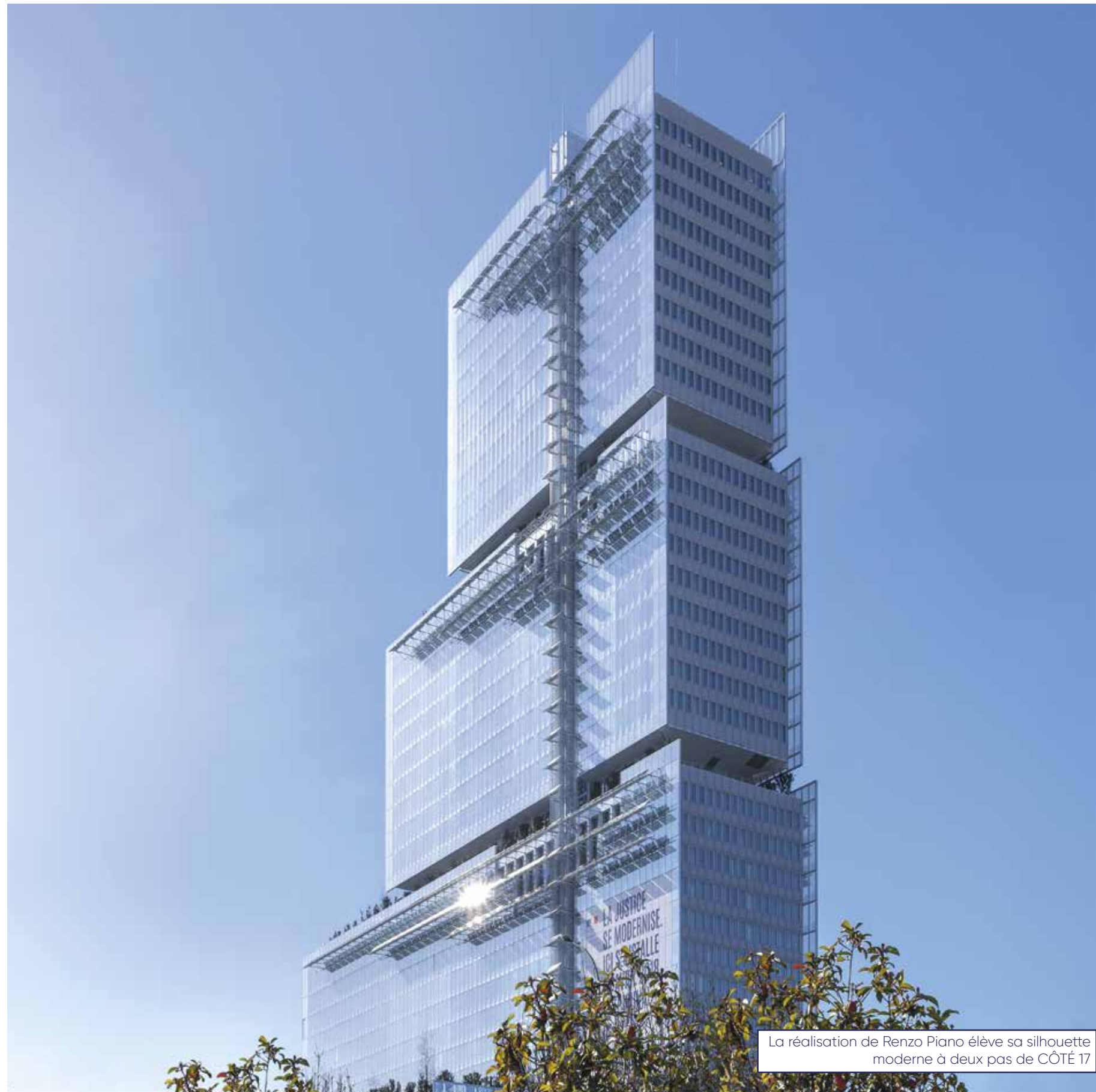
La réalisation de Renzo Piano élève sa silhouette moderne à deux pas de CÔTÉ 17